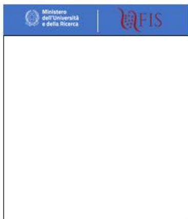
VERSIONE CON SOLO I DUE LOGHI ISTITUZIONALI