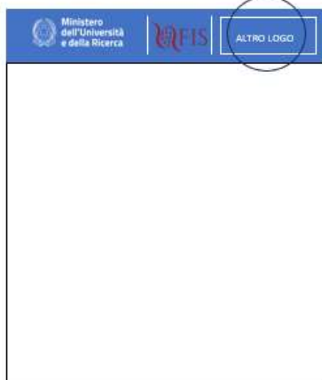
VERSIONE CON I DUE LOGHI ISTITUZIONALI E UN SOLO LOGO ENTE (SI POSIZIONA IN ALTO DIVISO DA LINEA BIANCA)